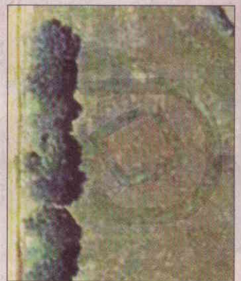
Eine klassische Luftbildaufnahme.

gische Schrägaufnahme: Die grünen Linienstrukturen stellen sich als Vegetationsmerkmal dar. Der äußere, umschließende Kreisgraben misst einen Durchmesser von 58 Metern, im Inneren zeichnet sich ein kleineres Grabenviereck (27 x 27 Meter) ab.