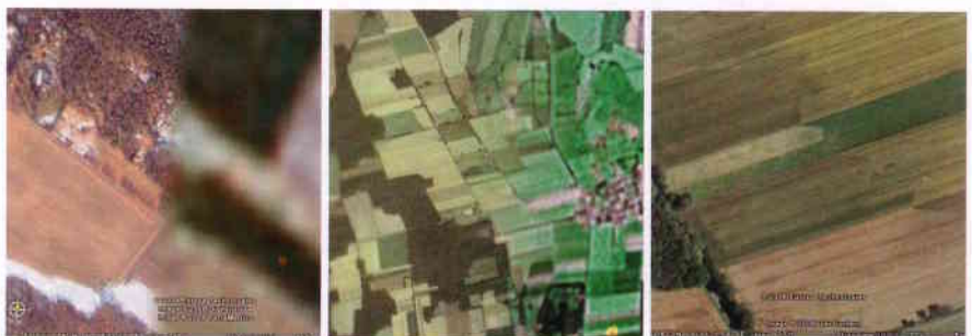
Bild 2 a, b, c: Nahtstellen / Bildübergänge zwischen Satelliten-, Luftbildern

Zur Untersuchung des Nutzens für die Luftbildarchäologie wurde das Weser-Aller-Leine-Gebiete oberhalb des Steinhuder Meeres gewählt. Es besteht im Wesentlichen aus einem einheitlichen hochaufge-