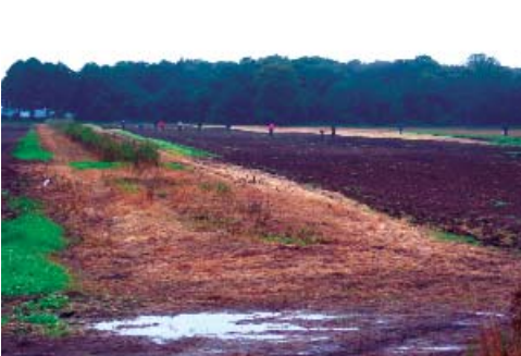
Mitglieder der Vereine und Helfer bei der Geländeinspektion

Siegelseite ein geschwungenes Wappenschild mit zwei gekreuzten Schlüsseln, u. a. den Attributen der Stadt Bremen. Innerhalb der Felder zwischen den gekreuzten Schlüsseln, befinden sich drei einzelne Punkte, unter den Schlüsseln ist ein schildförmiges kleines Dreieck zu sehen. Über