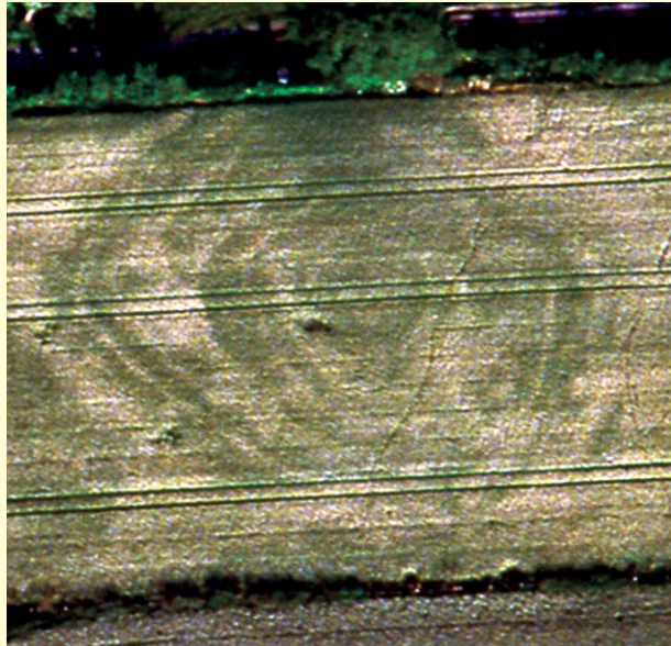
Durch Luftbildarchäologie neu entdeckte Fundstelle im Allertal

Eine geologische Entstehung scheint ausgeschlossen; hier haben Menschen gegraben. Aber wann und wozu? Vielleicht würde eine Ausgrabung helfen, zu einer Deutung und Datierung zu kommen, aber eigentlich soll die Luftbild-Prospektion ja gerade dazu helfen, die Bodendenkmäler zu schützen und nicht zu zerstören. Also müssen wir weiter versuchen, in alten Dokumenten, Karten und Büchern eine Erklärung zu finden. Oder direkt in der Landschaft.