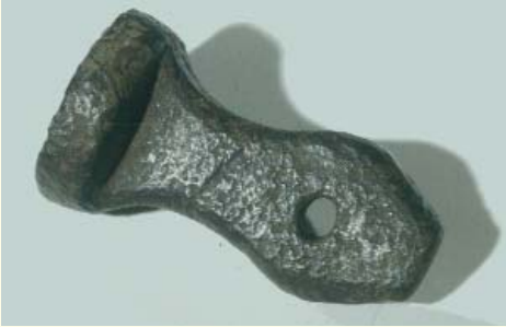
Seitenansicht des Typars.

Gefahr war im Verzug, denn sobald die Stelle allgemein als potentielle römische