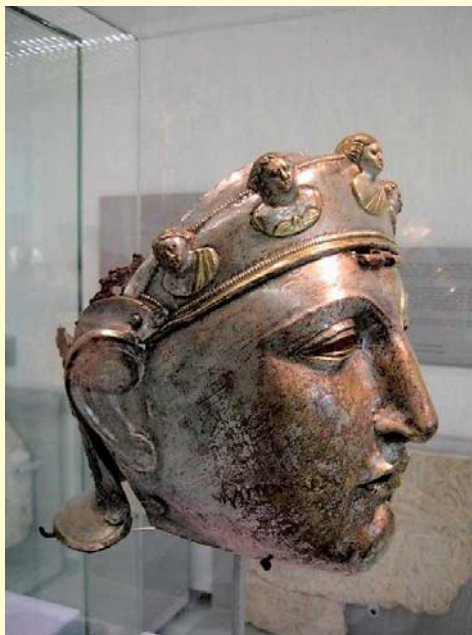
Römische Maske aus dem Museum "Het Valkhof".

Beim anschließenden Besuch der römischen Abteilung im Museum "Het Valkhof" standen die Funde im Mittelpunkt des Interesses, die aus den Grabungen auf den von den Römern militärisch genutzten Flächen "Hunerberg" und "Kops Plateau" stammen. Helme, Waffen, andere militärische Geräte, aber auch Grabsteine und die Münzfunde beeindruckten. Wichtig war auch die Erläuterung eines