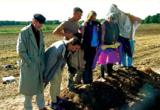
Helfer und Besucher spenden Schatten für das Detailfoto und studieren aufmerksam den Grabungsbefund

Nach all den aufwendigen Voruntersuchungen, zu denen selbstverständlich auch das Studium älterer Kartenwerke gehörte, blieb als "ultima ratio" ein Schnitt durch die im Luftbild sichtbaren Bewuchsmerkmale, hinter denen sich nur ein Graben verbergen konnte. Ein römischer Graben? Spannung lag in der Luft, als am Sonntag,