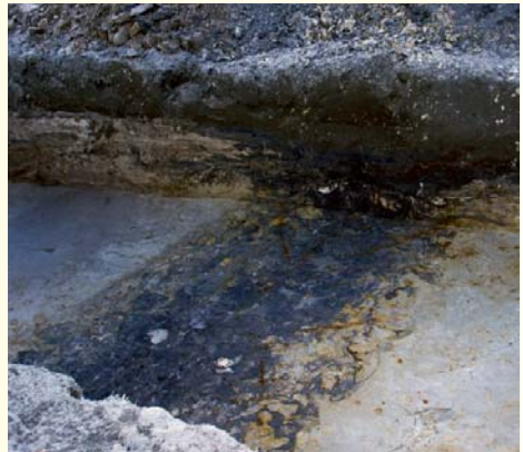
Der angeschnittene Graben im Flächenbefund.