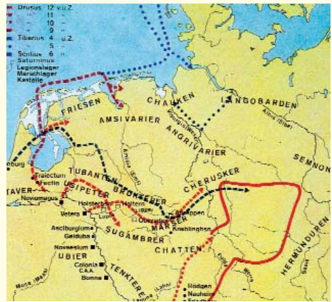
Feldzüge der Römer ins "Freie Germanien". Die blaugepunkteten Linien führen in das Gebiet des Luftbildbefundes. (Karte nach B. Krüger, Die Germanen, Bd.1, Berlin 1988)

dieses Beitrages, der zugleich mit der unermüdlich tätigen Arbeitsgemeinschaft, der "Römer AG" im Freundeskreis für Archäologie in Niedersachsen aufmerksame Akteure aufweisen konnte.