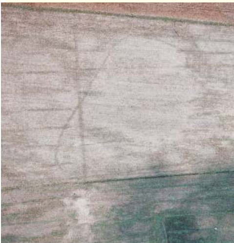
Luftbild von O. Braasch aus dem Jahr 1992. In der Bildmitte im hellen Umfeld eine dunkle Linie, die mit gerundeten Ecken rechtwinklig abbiegt.

Da die Römerforschung - sieht man von den Grabungen in Kalkriese ab - in Niedersachsen noch nie so richtig in Fahrt gekommen ist, gelangten die Bilder an den Verfasser