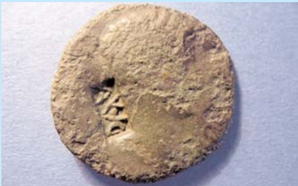
Fundort Lüne: Augustus, As, Lugdunum, Vs Gegenstempel AVC, 7-3 v. Chr.

Die Antwort auf die zweite Frage blieb offen; zur