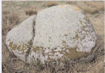
Sog. Opferstein von Melzingen

Denkmalpflege, die in den vergangenen Jahren zwischen Uelzen und Lüchow-Dannenberg aufgenommen wurden. Im Anschluss an die Luftbild-Dia-Schau besteht die Gelegenheit zum gemeinsamen Mittagessen in der Fußgängerzone. Und am Nachmittag werden archäologische Fundstellen westlich der Stadt in Richtung Soltau besucht, unter anderem die Burg Bode und die bronzezeitliche Steinkiste im Stadtwald. Das interessanteste Objekt ist jedoch der sogenannte "Opferstein von Melzingen": Inmitten der ehemaligen