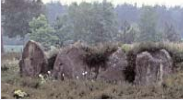
Großsteingrab der Nekropole Oldendorf

der Adelssitz der Familie von Lopau in Langlingen, Lkr. Uelzen, die verfallene Siedlungsstelle Konstantinopel in Ehlbeck sowie der vergangene Klosterhof "Haus der Heiligen Maria (bis 1252) in Steinbeck/Luhe. Den circa 15 Exkursionsteilnehmern wurde