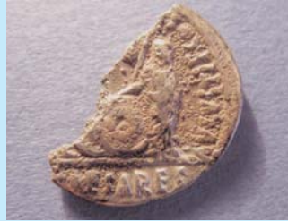
Fundort: Gleesen: Augustus, halbiertes Denar, Gaius/Lucius-Typ, 2 v. Chr. - 1 n. Chr.

ersten gab im folgenden Abschnitt der Tagung - moderiert von Prof. Callies - Dr. A. Kaltfofen einen Überblick über den Stand der archäologischen Forschung im Emsland: Römische Funde gibt es - verglichen mit steinzeit- oder bronzezeitlichen - nur wenige. Ältere Münzschatzfunde sind völlig bzw. bis auf ganz geringe Reste verschollen. Keine Fundstelle ist