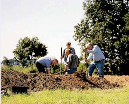
FAN Mitglieder bei der Freilegung

Im Jahre 2003 wurde beim Bau einer Erdgasleitung in der Nähe von Bad Bevensen ein Friedhof der sogenannten Langobarden aus dem 1. Jh. nach Christus entdeckt. Sämtliche Urnengräber waren durch den Pflug zerstört; es fanden sich aber noch Reste von Gefäßen und metallischen Beigaben. Im Oktober 2005 suchte H.-D. Freese, FAN, nach Absprache mit dem NLD / Herrn Dr. Gebers den abgeernteten Kartoffelacker mit einem Metallsuchgerät ab.