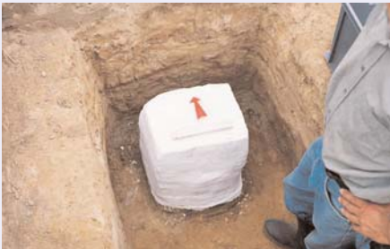
Der Erdblock um den Eimer ist mit Gipsbinden stabilisiert

Die Dämmerung war schon hereingebrochen, als das Gerät einen leisen Ton von sich gab, der auf Buntmetall schließen ließ. Im Pflugbereich fand sich nichts, der Ton wurde jedoch deutlicher. Deshalb schüttete H.-D. Freese schweren Herzens die Grube wieder