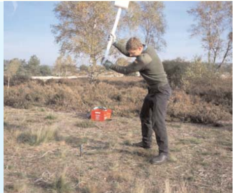
Arbeiten mit dem Pürckhauer

Der mittelsteinzeitliche Fundplatz bei Haverbeck, Ldkr. Soltau-Fallingb., wurde bereits 1998 ausgegraben, nachdem weiträumige Verwehungen, die durch die Nutzung des Geländes als Panzerübungsraum und damit einhergehender Zerstörung der Heidevegetation entstanden waren, erste Artefakte freigelegt hatten. Da auf Grund dieser speziellen Geländesituation Beobachtungen zur Stratigraphie während der Grabung wegen des Fehlens der oberen Bodenhorizonte nur sehr eingeschränkt möglich waren, schien eine weiträumigere Sonde des Geländes im Oktober 2006 sinnvoll.