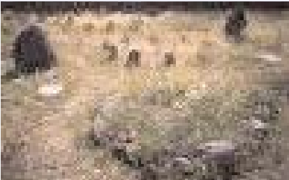
Steinumhegungen der Nekropole Soderstorf

deutlich, dass die vorgefundenen Wüstungen mit ihren angelegten Wegen, Mauern, Wällen, Gräben, Äckern und Feldern wichtige und schätzenswerte Zeugnisse unserer Heimatgeschichte sind.