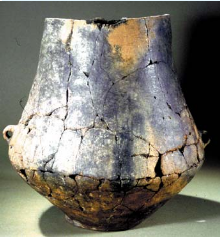
Urne aus dem Gräberfeld der jüngeren Bronzezeit in Rullstorf, Ldkr. Lüneburg.

vor rund 3200 Jahren gab es in Europa eine umwälzende Neuerung: Die Toten wurden plötzlich nicht mehr in Erdhügeln oder in Steinkisten bestattet, sondern eingäschert und in einer Urne beige-setzt. Warum, das wissen wir nicht. Wir können nur verfolgen, wie sich die neue Sitte immer mehr ausbreitet von Süden nach Norden.