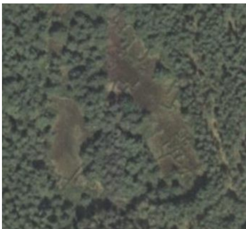
Abb. 1 BILD links

Von der Luftbildsituation der Fundstelle wird eine Momentaufnahme gemacht nach dem Prinzip eines „Screenshots“ am Bildschirm (Abb. 1a). Für das Zurechtschneiden eines sauberen Ausschnittes kann man sich eines universellen Programms zur Bildbetrachtung, -bearbeitung (z.B. IrfanView) bedienen. Dieses Ergebnis wird als Bilddatei abgelegt. Aus der gleichen Luftbildsituation kann die geographische Position in Länge und Breite herausgeschnitten werden. Den absoluten Koordinatenbezug kann man sich aus einer Topographischen Karte (Abb. 1b) holen, im speziellen Fall mit dem Programm TOP50, welches flächendeckend die Karte 1 : 50.000 von Niedersachsen bereitstellt. So wird hier der entsprechende Ausschnitt mit der mittelbaren Umgebung für Übersichtszwecke herausgeschnitten. Vorher kann ein Markierungskreis/ -quadrat an der Fundstelle gesetzt werden. Gleichzeitig kann seitlich (horizontal, vertikal) das Koordinatengitter / Randleiste mit eingeblendet werden. Für die genaue Position der Fundstelle (Mauszeiger dort platzieren), wird entsprechend (s.o. Länge, Breite im WGS) die „niedersächsische“ Gauss-Krüger-Koordinate plus Höhenbezug herausgeschnitten.